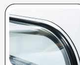
Verres incurvés latéraux et avant