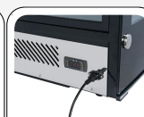
Socle en acier inoxydable avec dispositif de commande numérique