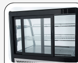
Portes coulissantes arrière