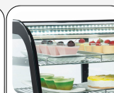
Lampe LED interne